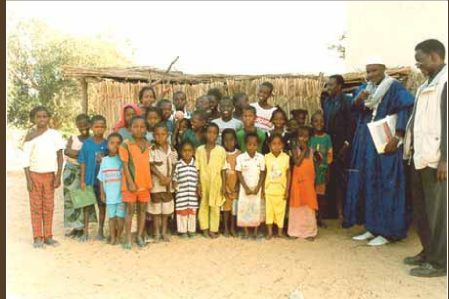
L'école du village de Djougoup